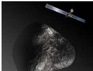
La sonde Rosetta et la comète Churyumov-Gerasimenko